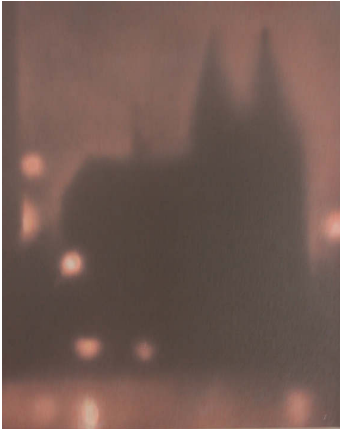
Köln, 2020 Mischtechnik auf Leinwand 50 x 40 cm 2.700,00 €