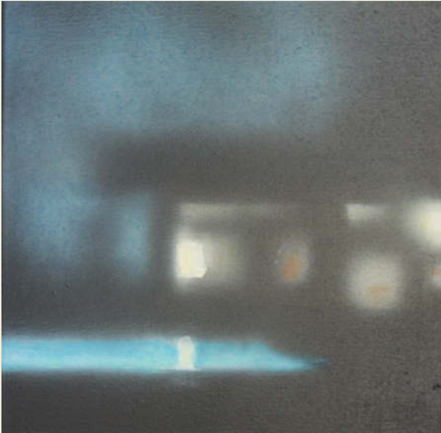
Pool-Party, 2020 Mischtechnik auf Leinwand 30 x 30 cm 1.800,00 €