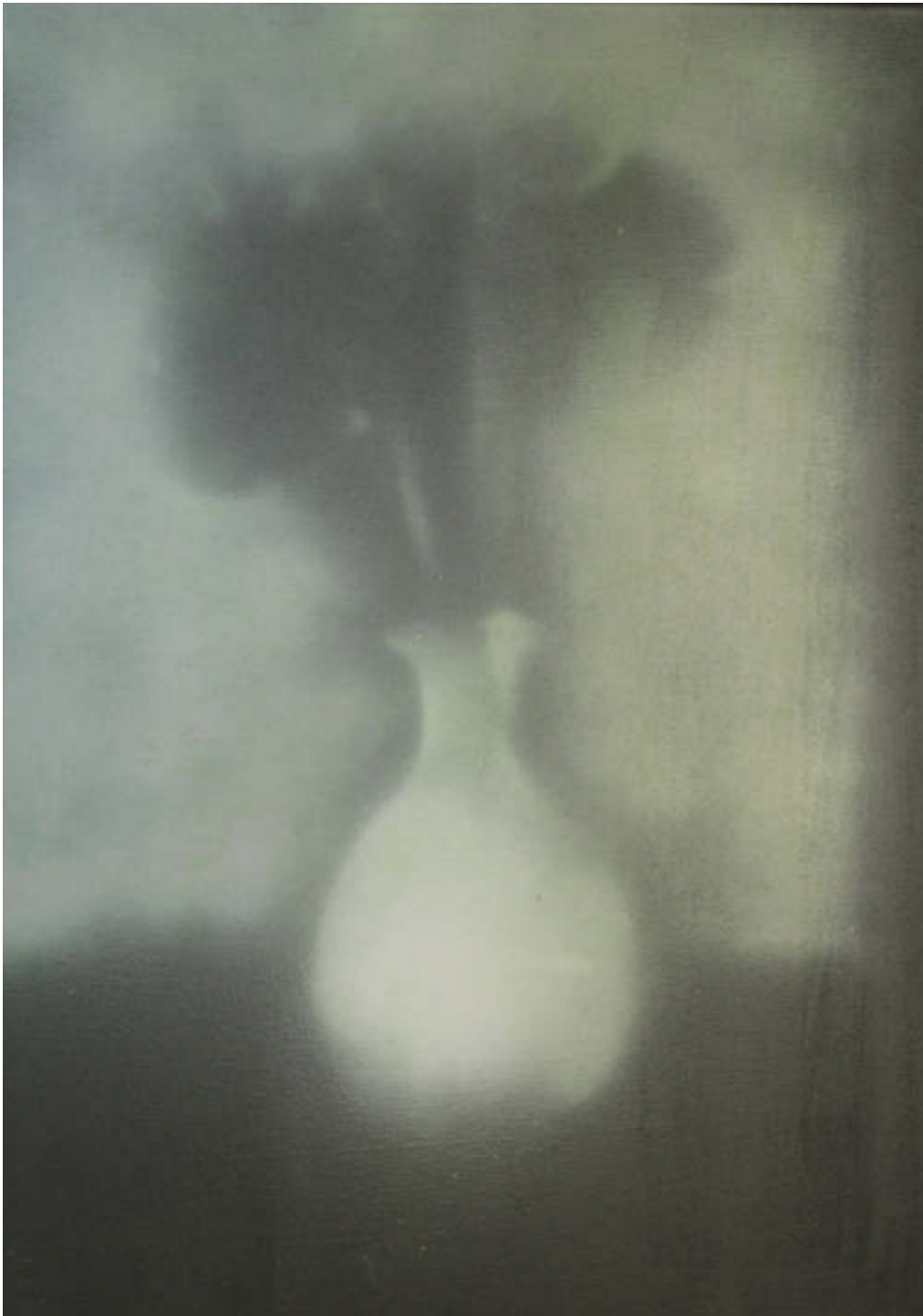
Nur nicht aus Liebe weinen, Nr. 6 Mischtechnik auf Leinwand 70 x 50 cm, 3.600,00 €