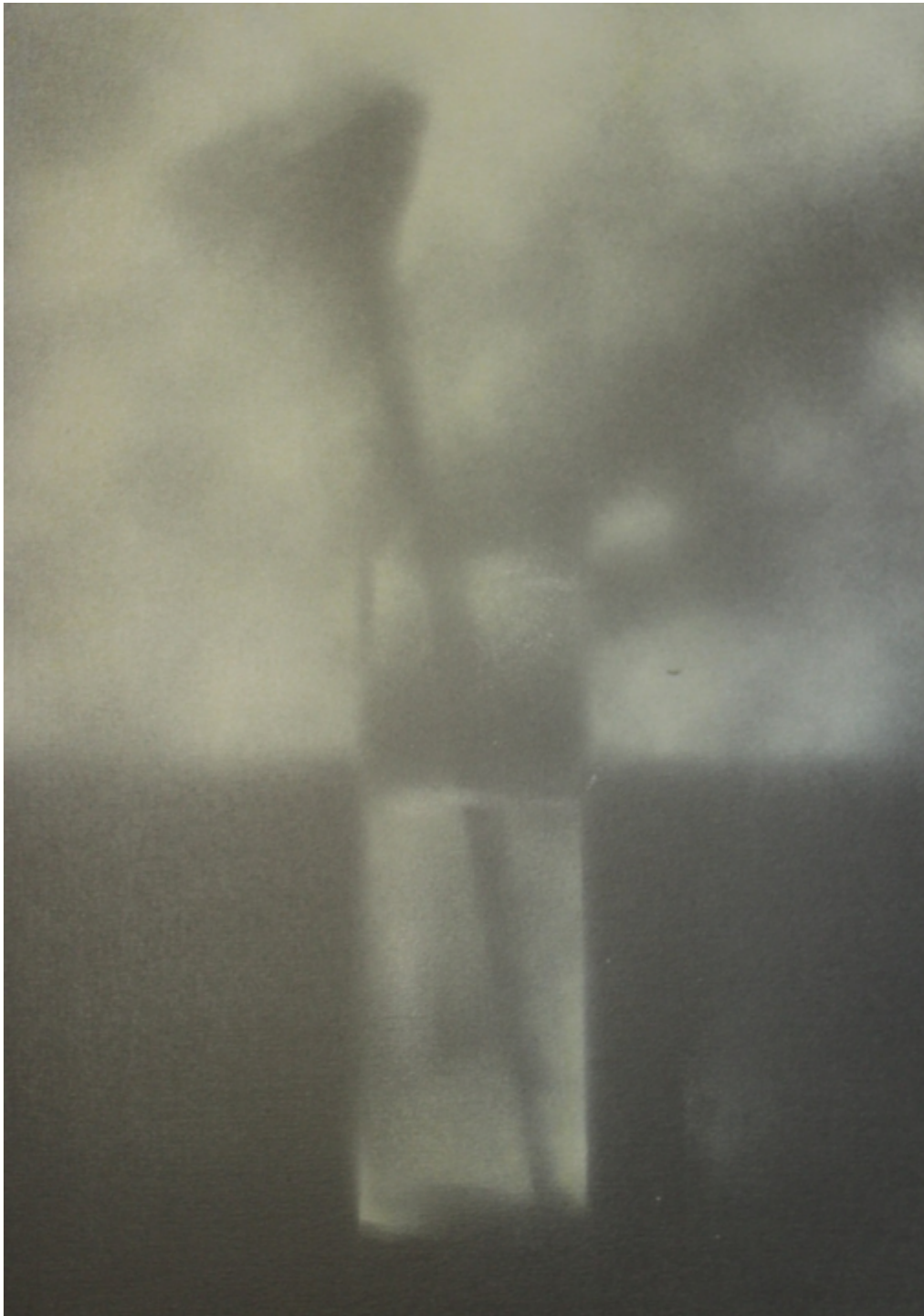
Nur nicht aus Liebe weinen, Nr. 2 Mischtechnik auf Leinwand 70 x 50 cm, 3.600,00 €