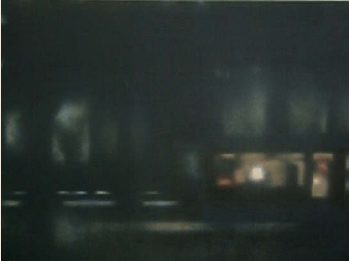
Indiz 6, 2020 Mischtechnik auf Leinwand 70 x 100 cm 5.000,00 €