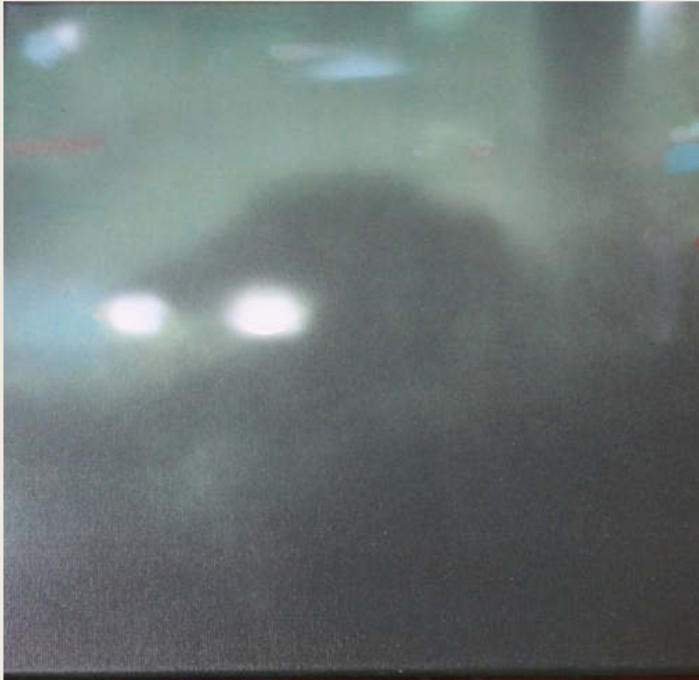
Pendler (August) Mischtechnik auf Leinwand 70 x 50 cm, 2.400,00 €