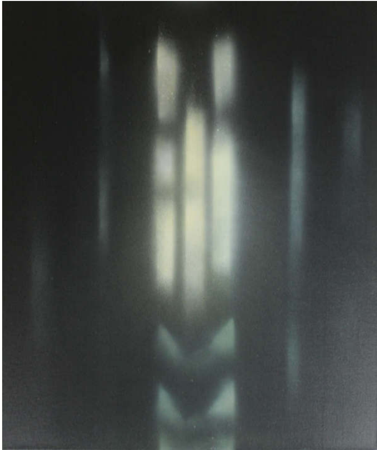
Kyrie II, 2020 Mischtechnik auf Leinwand 70 x 50 cm 3.600,00 €